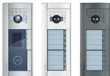
AllMétal AllWhite AllStreet