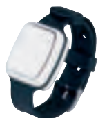
0 766 20