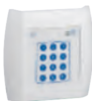
0 766 22