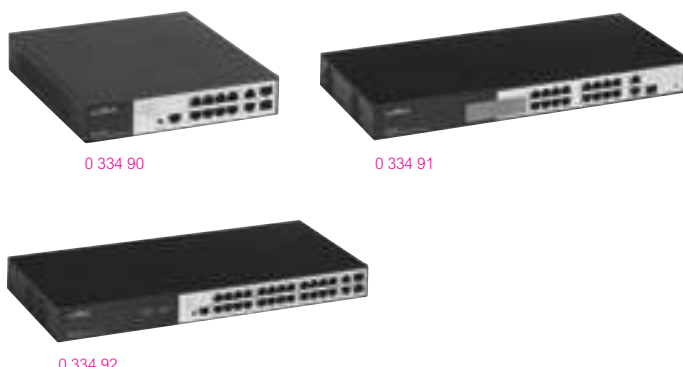
0 334 90