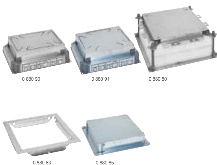
Tableau de choix p. 914 à 917 Caractéristiques techniques p. 922 à 924

Conformes aux normes IEC/EN 60670-23 Pour installation dans chape béton