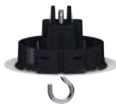
0 885 20