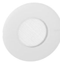
0 885 30