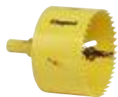
0 885 08