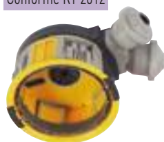
0 885 00