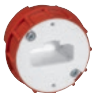
0 892 04