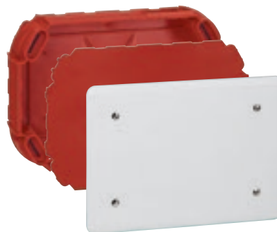
0 892 75