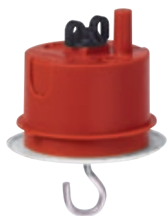
0 892 37