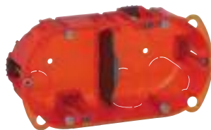
0 801 22