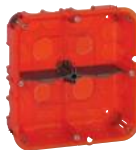
0 801 24