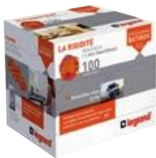
0 801 15