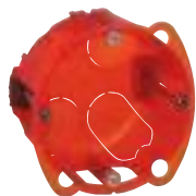
0 801 01