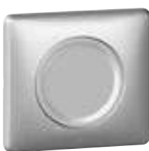
0 674 08 + enjoliveur + plaque Titane 0 689 01

Tableau de choix mécanismes et enjoliveurs p. 639 Tableau de choix plaques et supports p. 646-647