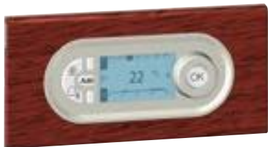
0 674 02 + enjoliveur + plaque Acajou 0 692 25