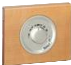
0 674 00 + enjoliveur + plaque Erable 0 692 11