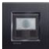
L4658N + plaque Anthracite LNA4802AR