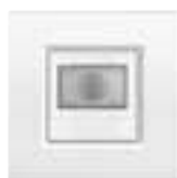
N4659N + plaque Blanche LNA4802BI