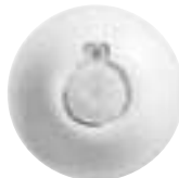
0 488 20