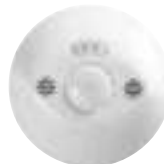
0 488 22

Tableau de charges et consommations p. 607-608 Schéma d'installation p. 602