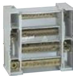
0 048 77