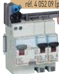
4 116 51