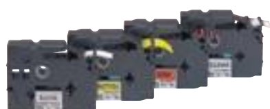
0 389 03/05/06/09