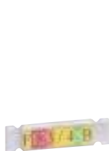
0 387 14 avec porte-repère 0 387 16