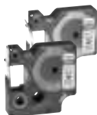
0 385 82/87