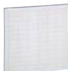
0 387 27

Impression et tenue garanties uniquement avec l'imprimante réf. 0 387 00 Utilisation intérieure