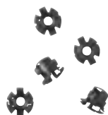
0 200 92