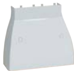
0 201 60