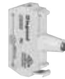
0 230 82