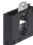
0 229 68

Caractéristiques techniques p. 284 et catalogue en ligne Mode de montage des étriers catalogue en ligne