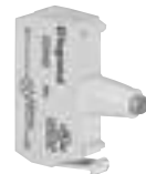
0 229 42