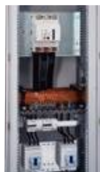
Armoire réf. 0 472 53 sans plastron XL 3 , cadre plastron réf. 0 474 82 et montants réf. 0 474 80