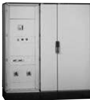
Armoire réf. 0 472 53 x 2 + gaine à câble 0 472 51