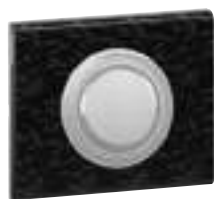
0 670 68 + enjoliveur + plaque Cuir Pixel 0 694 51