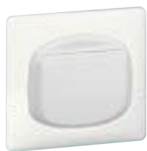
0 675 64 + enjoliveur + plaque Blanc 0 666 31