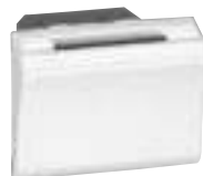
0 784 45