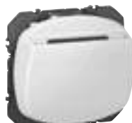
6 000 33