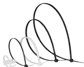
0 320 61/14/55/19/20