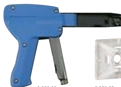
0 320 88