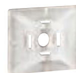
0 320 65