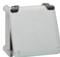
0 358 00