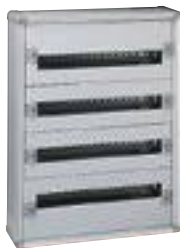
0 200 04

Tenue au feu selon IEC 60695-2-11 : 750 °C pour installation dans les ERP Châssis extractible avec rails montés Barreau laiton pour conducteurs de protection monté : 36 trous 1,5 à 10 mm 2 et 2 trous 35 mm 2 Capacité 24 modules par rangée RAL 7035 Livrés complets avec rails et plastrons Portes à commander séparément Permettent la réalisation d'ensembles certifiés selon NF EN 61439-2 et -3 IP 43 - IK 08 avec joint et porte IP 40 - IK 08 avec porte IP 30 - IK 07 sans porte Flancs latéraux amovibles Haut et bas amovibles et sécables pour insérer la plaque passe-câbles découparable (à commander séparément)