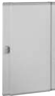
0 202 55