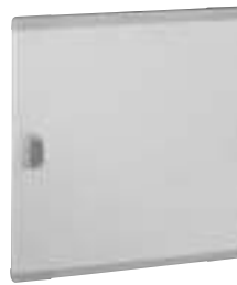
0 202 73