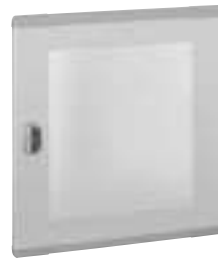
0 202 83