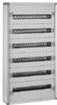
0 200 06

coffrets de distribution métal "prêts à l'emploi"