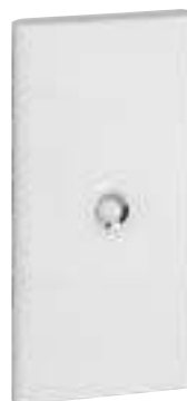
4 013 33