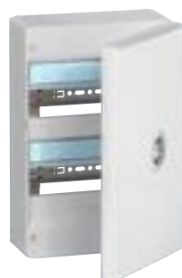
4 012 12 + 4 013 32