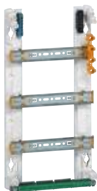
4 012 13 sans capot