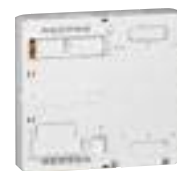
4 011 82