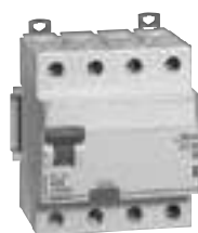
4 116 95