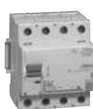
4 118 48

Caractéristiques techniques p. 544 Performance des différentiels p. 548