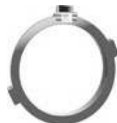
0 260 98