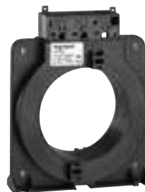
0 260 93