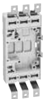
4 222 22