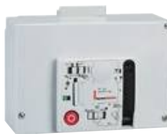
0 261 27