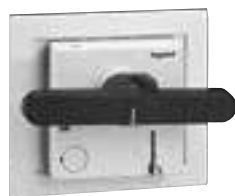
0 262 61