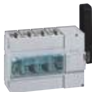
0 266 47