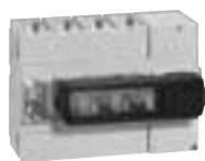
0 266 37