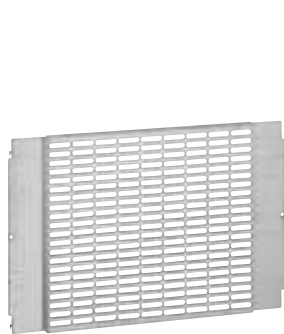
0 206 42