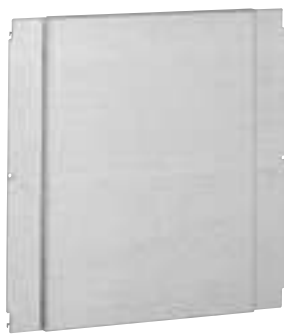
0 206 45