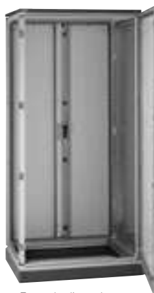
Exemple d'armoire avec cloison de séparation réf. 0 480 43