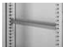
0 480 15 Traverse horizontale