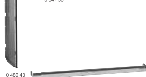
0 480 43