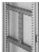
Traverses multi-fonctions réf. 0 480 24 et 2 x 0 480 25