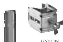
0 347 38