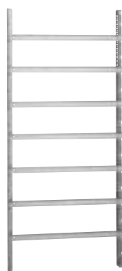
Exemple de châssis réalisé avec montants profilés 0 475 52 et rails 0 477 28