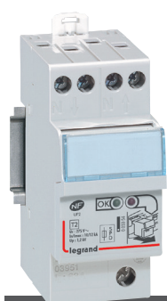
Parafoudre avec cassette débrochable : remplacement facilité