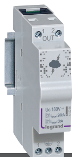
Parafoudre pour protection ligne téléphonique du réseau multimédia