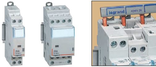
4 125 05