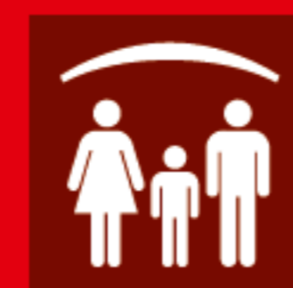
Protection des personnes