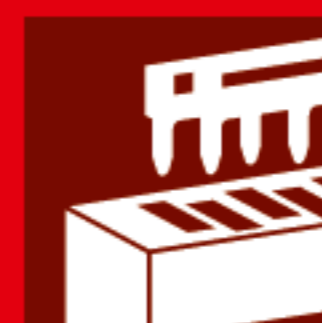
Raccordement par peigne