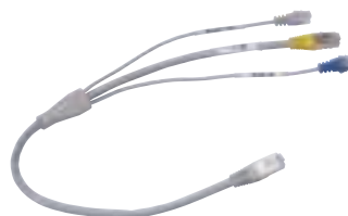
4 132 05

Principes d'installation et caractéristiques techniques p. 594-595