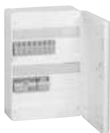
4 132 61