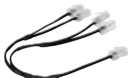
4 132 04