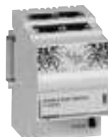
4 131 22