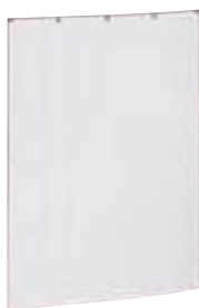
0 387 20