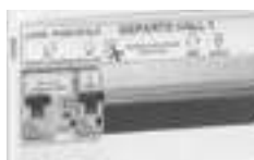
Exemple d'un coffret équipé d'une étiquette 0 387 20 avec porte-repère 0 203 99 (p. 327) et d'étiquettes pour modulaire 0 387 31/32 (p. 448)