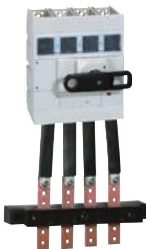
0 265 04