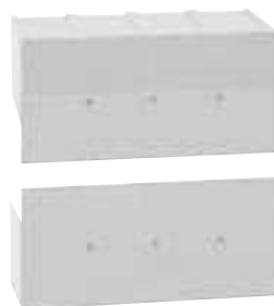
0 262 65

Caractéristiques techniques p. 373 Cotes d'encombrement catalogue en ligne