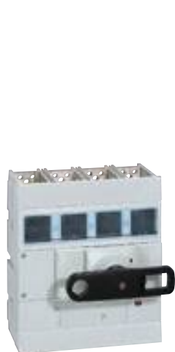
0 265 98

interrupteurs-sectionneurs 800 A à 1600 A