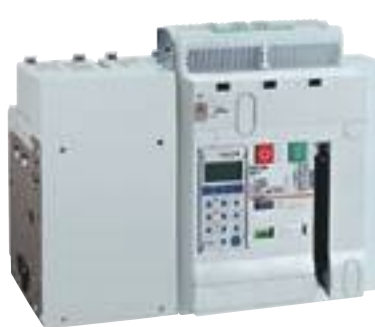
0 286 77 + 0 288 02 (p. 358)

Caractéristiques techniques p. 365 Cotes d'encombrement catalogue en ligne