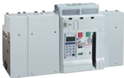
0 289 51 + 0 288 02 (p. 358)

Caractéristiques techniques p. 365 Cotes d'encombrement catalogue en ligne