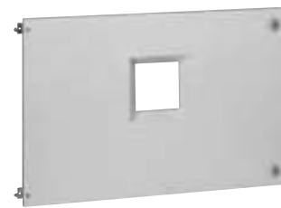
0 212 34