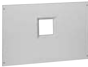
0 209 34