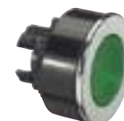
0 240 09

Caractéristiques techniques p. 284 et catalogue en ligne