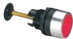
0 238 61

Caractéristiques techniques p. 284 et catalogue en ligne