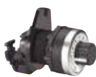
0 239 89