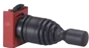
0 239 91

auxiliaires de commande et de signalisation (suite)