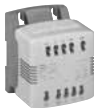
0 442 51