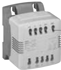
0 442 02