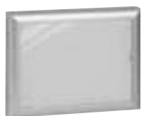
0 475 45