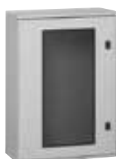
0 362 76

Tableau d'aide au choix p. 158 Caractéristiques techniques p. 174