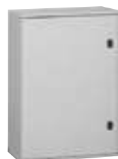
0 362 56