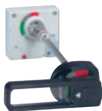
0 262 79