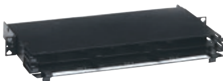
0 321 90