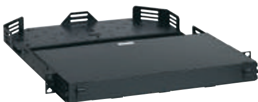
0 321 50