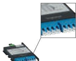
0 321 94