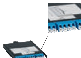
0 321 55