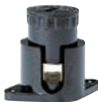
0 340 45