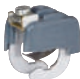
0 343 85