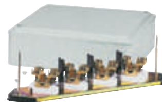
0 330 74