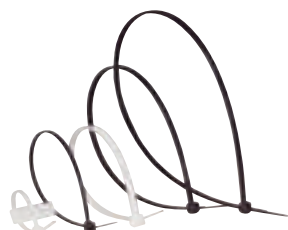
0 320 61/14/55/19/20