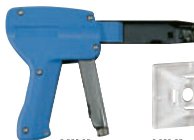
0 320 88