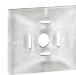
0 320 65