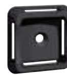
0 320 68