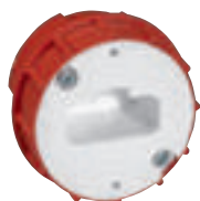
0 892 04