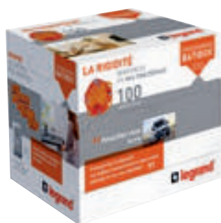
0 801 15