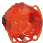
0 801 01