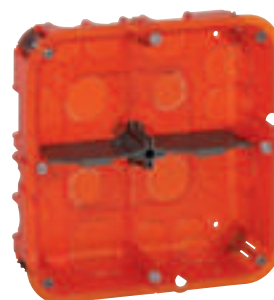
0 801 24