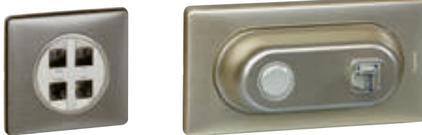
0 673 94 + enjoliveur + plaque Tungstène 0 689 71