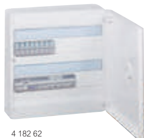
4 182 62