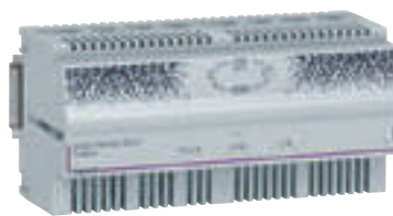
4 130 44

Principes d'installation et caractéristiques techniques p. 594-595