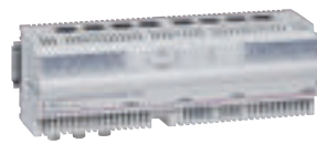
4 130 38