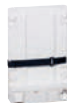
4 131 49

Principe d'installation et caractéristiques techniques p. 594-595