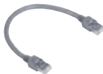
4 130 45