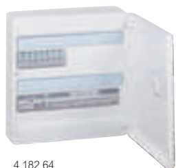
4 182 64