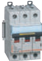
4 092 79