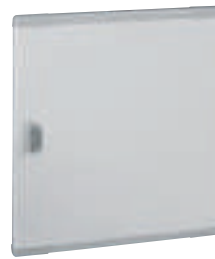
0 202 73