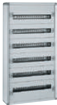
0 200 06

coffrets de distribution métal "prêts à l'emploi"