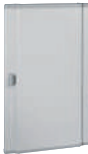
0 202 55