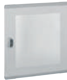
0 202 83