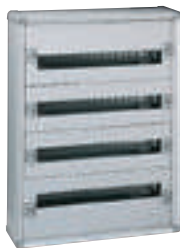
0 200 04

Tenue au feu selon IEC 60695-2-11 : 750 °C pour installation dans les ERP Châssis extractible avec rails montés Barreau laiton pour conducteurs de protection monté : 36 trous 1,5 à 10 mm 2 et 2 trous 35 mm 2 Capacité 24 modules par rangée RAL 7035 Livrés complets avec rails et plastrons Portes à commander séparément Permettent la réalisation d'ensembles certifiés selon NF EN 61439-2 et -3 IP 43 - IK 08 avec joint et porte IP 40 - IK 08 avec porte IP 30 - IK 07 sans porte Flancs latéraux amovibles Haut et bas amovibles et sécables pour insérer la plaque passe-câbles découparable (à commander séparément)